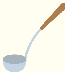
たまじゃくし (おたま)