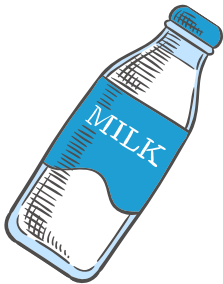
ぎゅうにゅう 牛乳