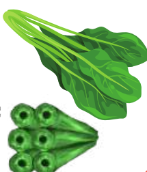
ほうれん草 ほうりんそう